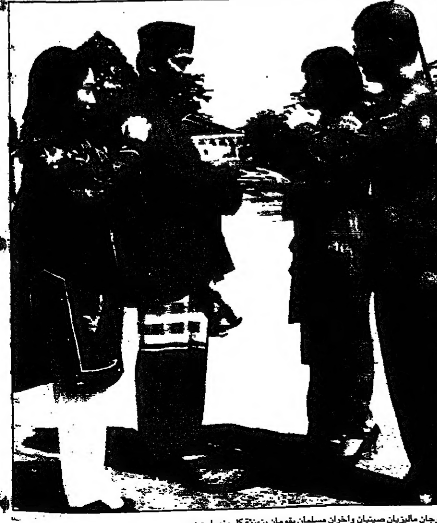
زوجان ماليزيان صينيان واخران مسلمان يقومان بتهنئة كل منهما بمهده

9,00 القران الكريم، 9,30 مساء الخير اوريد، 10,00 برنامج مغالبة شخصية، 11,30 برنامج وثائقي، بحال الحيوان، 12,15 فاصل غنائي، 12,30 مسلسل مصري، بكيزة وزغلول، 13,30 برنامج فيديو كليب، 14,00 مسلسل مديح العطن، 15,00 برنامج نشاطا بالخروج، 15,30 برنامج اغاني وجوه، 16,30 مسلسل مصري، احلام مسرورة، 17,30 برنامج الجانب الآخر، 18,30 برنامج على الهواء، 20,00 مسلسل لبناني، العاصمة تهب مرتين، 21,00 برنامج منوعات، كان زمان، 23,00 برنامج في سكون الليل، 23,15 فاصل غنائي، 23,30 برنامج نشاطا بالخروج، 00,00 مسلسل مصري، احلام مسرورة، 1,00 برنامج فيديو كليب، 1,30 برنامج الجانب الآخر، 2,30 مسلسل لبناني، العاصمة تهب مرتين، 3,30 الختام بالقران الكريم.